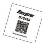
❷ User Manual