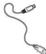
❸ Charging Cable